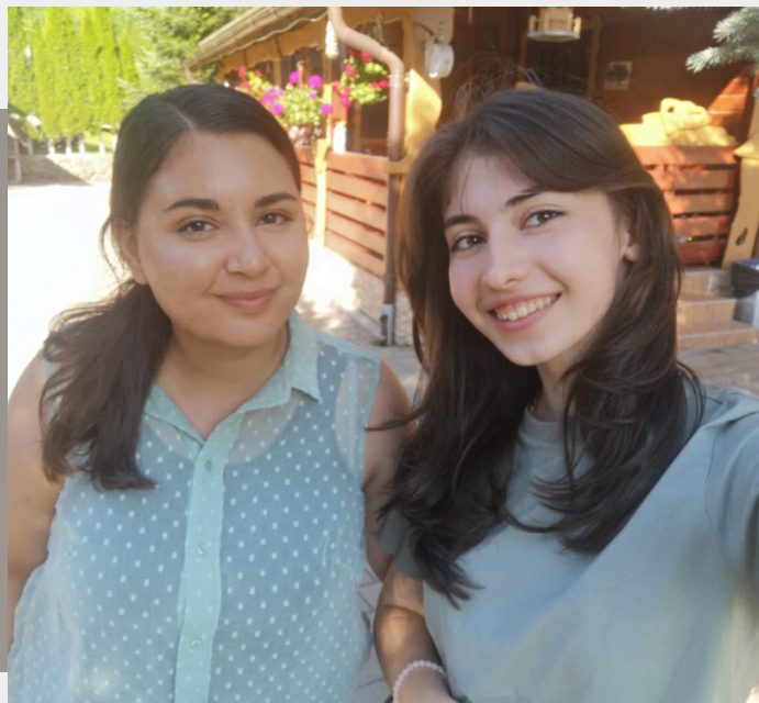
La tabăra de retreat Wycliffe România, împreună cu o fată tare dragă mie